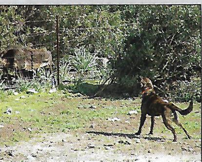
H'Ribombu di i Ribelli di Terra Corsa au ferme sur sanglier mécanique à Lesia Fondacci avec 62 sur 70 points.

Le 12 mars 2017, a eu lieu la validation du premier TAN cursinu à l'initiative du Club du cursinu. Les épreuves se sont déroulées à Altiani en Haute Corse, à la station de l'ODARC (Office développement agricole rural en Corse).